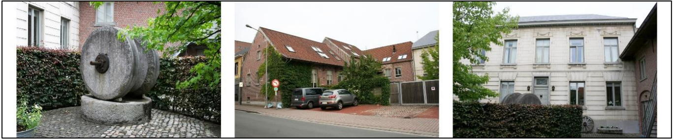
Wat nu nog rest van de gebouwen van brouwerij Sergoyne/Victoria in de Gasthuisstraat.