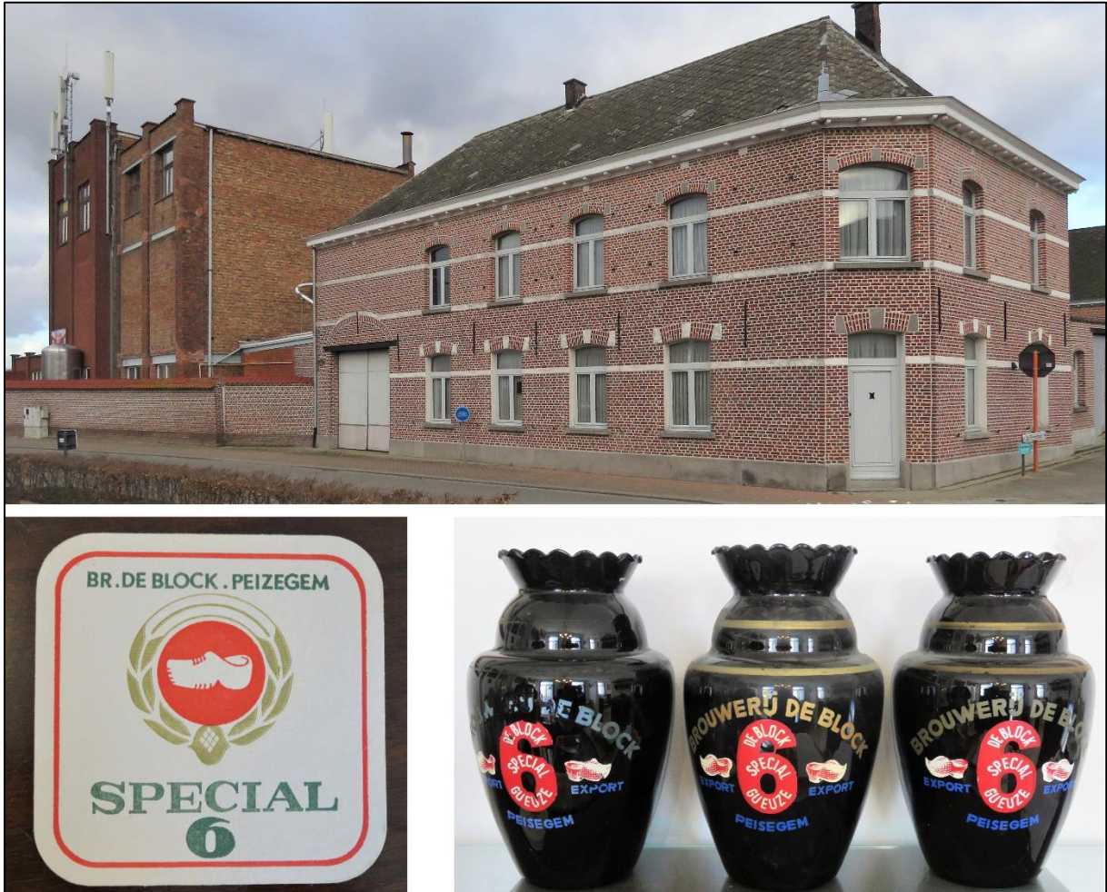
Brouwerij De Block en het brouwershuis, waarin ook een museum is ondergebracht

Biersoorten zijn de amberkleurige Satan Red (8%), de blonde Satan Gold (8%), de (donkere) Satan Black (8%), Satan White (4,7%), Dendermondse Tripel (8%) en de (goudblonde) Kastaar (5,5%).