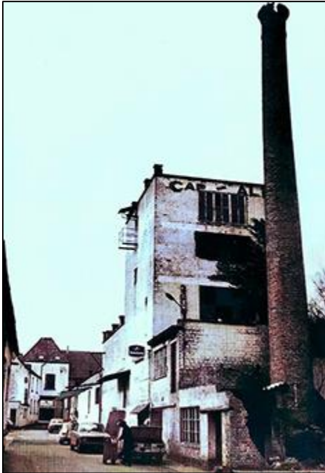
De gebouwen van de voormalige brouwerij tussen de Bogaerdstraat en de Stoofstraat

In deze reeks willen we terugblikken op de talrijke brouwerijen die groot Merchtem ooit rijk was. En vanzelfsprekend komt tenslotte ook de nog bestaande brouwerij De Block uit Peizegem aan bod. We starten alvast met de brouwerij Van Cappellen.